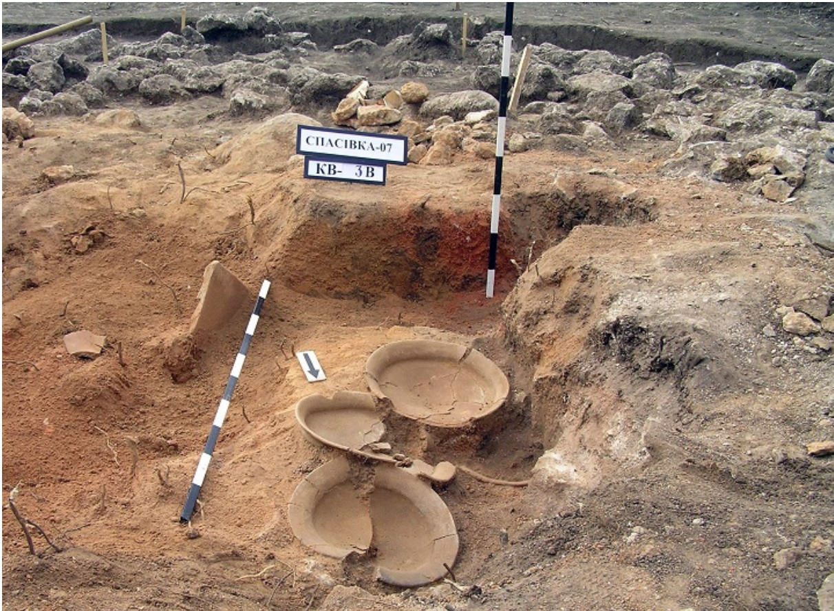
На фото –розкопки одного із легендарних курганів. Як бачимо - це класичне ранньоскіфське поховання.

А це вже відгомін відомого єврейського переказу про вдову Ханну й сім її синів, зафіксованого в Книгах Макавеїв і Талмуді.