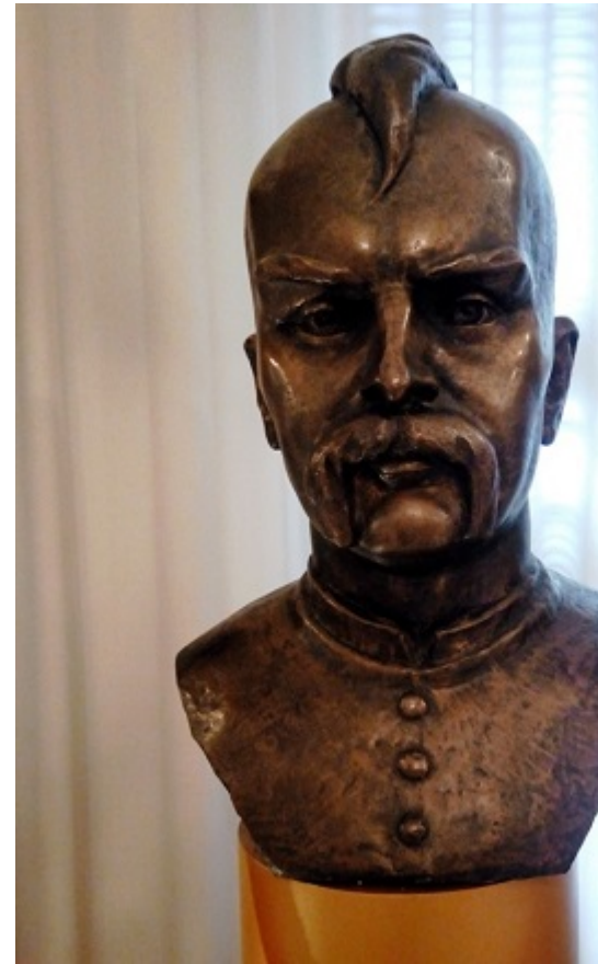
Бюст полковника Нечая

Вероятно, легенда о семи могилах родилась среди евреев Сатанова, для которых семь курганов у Гусыковой горы символизировали семь могил-алтарей Ханны. Этому способствовали и представления о полковнике Нечае как современном воплощении кровавого Антиоха Эпифана. Впоследствии эта легенда перешла в фольклор живущих рядом христиан. Тем более, что к Нечаю в Сатанове не питали особой любви ни иудеи, ни католики, ни униаты, ни православные.