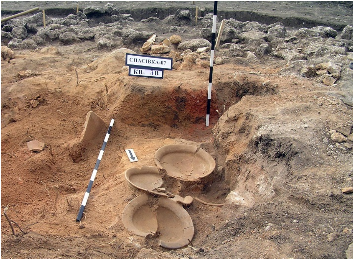
На фото – раскопки одного из легендарных курганов. Как видим – это классическое раннескифское погребение.

Мол, во времена Хмельнитчины, когда брацлавский полковник Данило Нечай со своими казаками приближался к Сатанову, ему навстречу вышли защитники города — некая вдова и семь ее сыновей, каждый из которых стоял во главе собственной дружины. Силы были неравны, и все смельчаки погибли. Павших похоронили в семи курганах.