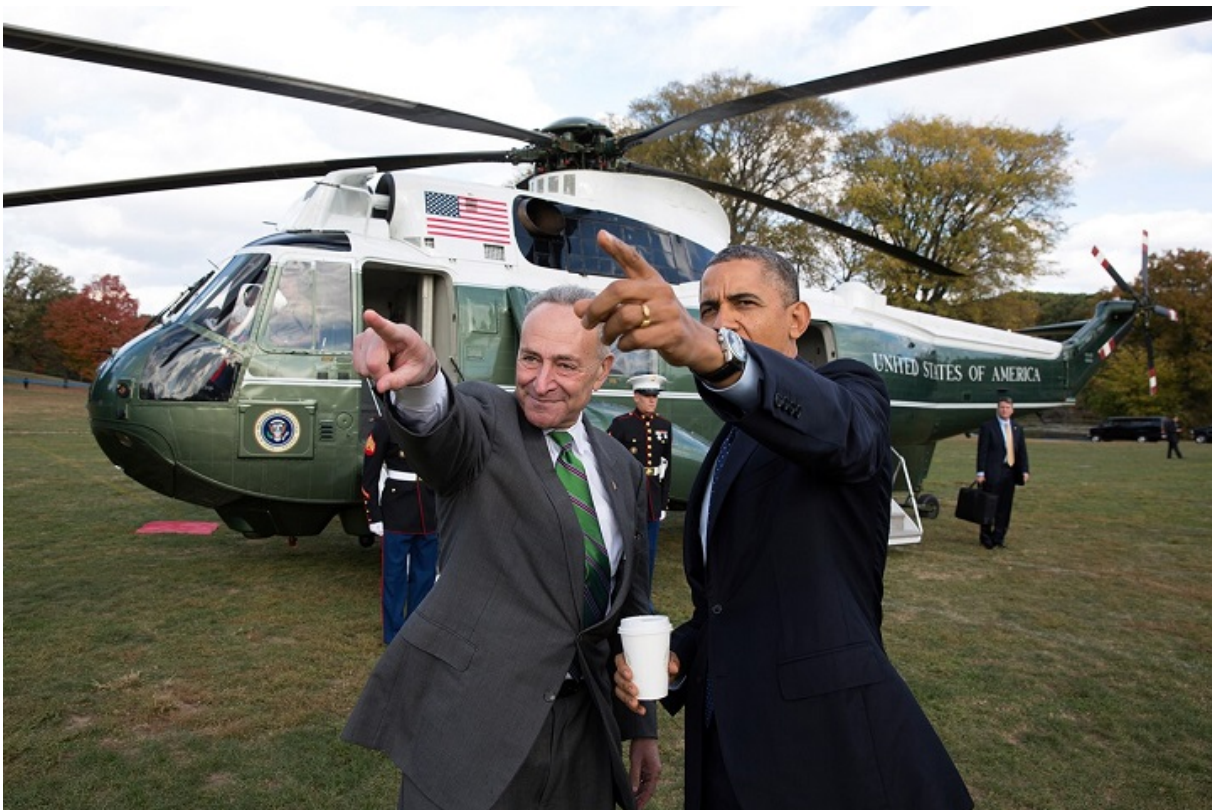
Президент Барак Обама з сенатором Шумером, 2013

Схильність Шумеру до публічності стала притчею во язицех. Сенатор-республіканець Боб Доул одного разу пожартував, що «найнебезпечніше місце у Вашингтоні — між Чарльзом Шумером і телекамерою».