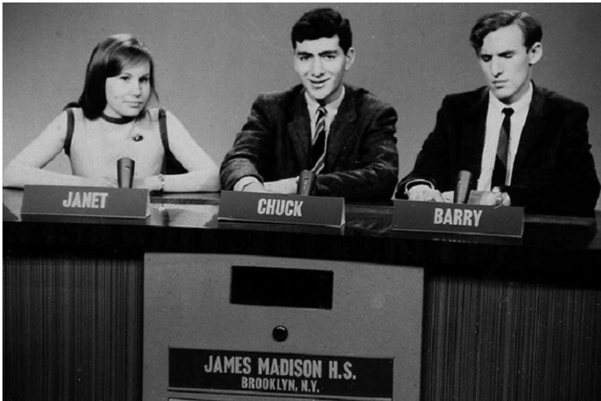
Чак Шумер (у центрі) — учасник телевікторини «It's Academic»

Здобувши диплом із відзнакою, молодий чоловік продовжив освіту у Юридичній школі Гарварду. У 1974-му 23-річний д-р права Чарльз Шумер став наймолодшим членом Законодавчих зборів штату Нью-Йорк із часів Теодора Рузвельта. Він пропрацював тут шість років, після чого був обраний у Конгрес від округів Бруклін і Квінс.