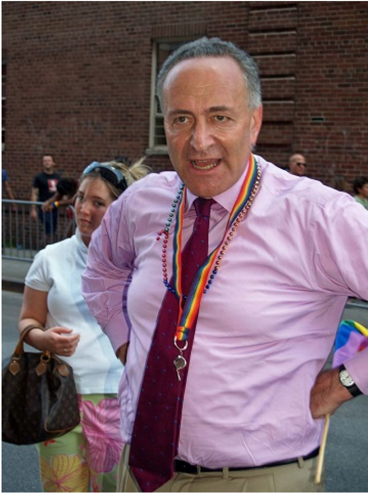
Чак Шумер на гей-прайді, Нью-Йорк.