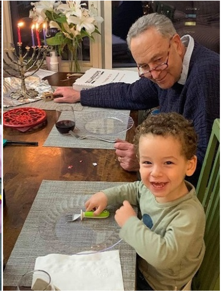
Сенатор запалює ханукію з онуком Ноахом

У травні 2017 року сенатор став співавтором Закону про заборону бойкоту Ізраїлю. Закон оголосив бойкот федеральним злочином, максимальне покарання за яке передбачає 20 років ув'язнення. Він також легалізував відмову США від укладання угод із підрядниками, які бойкотують Ізраїль.