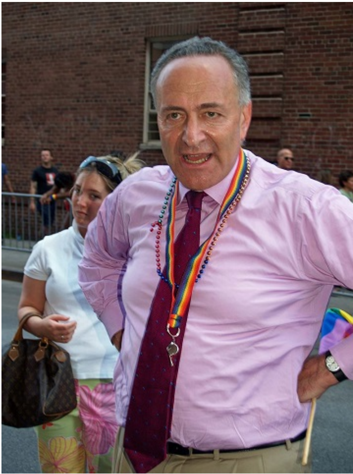
Чак Шумер на гей-прайде, Нью-Йорк.