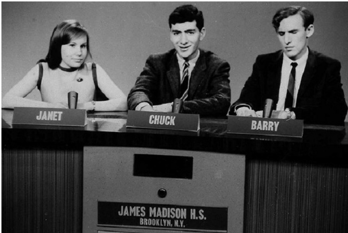
Чак Шумер (в центре) — участник телевикторины «It's Academic»

Получив диплом с отличием, молодой человек продолжил образование в Юридической школе Гарварда. В 1974-м 23-летний д-р права Чарльз Шумер стал самым молодым членом Законодательного собрания штата Нью-Йорк со времен Теодора Рузвельта. Он проработал здесь шесть лет, после чего был избран в Конгресс от округов Бруклин и Квинс.