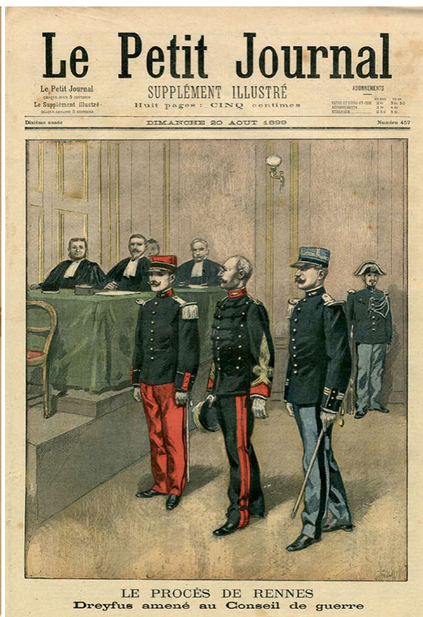
На повторном процессе по делу Дрейфуса, 1899

Среди евреев — уроженцев Мюлуза немало имен, которыми город может по праву гордиться, например, немецкий математик Фридрих Леви и трехкратный обладатель «Оскара» голливудский режиссер Уильям Уайлер. Правда, в отличие от них Альфред Дрейфус был и остался французским патриотом, что объясняет столь трепетное отношение к этой фигуре.