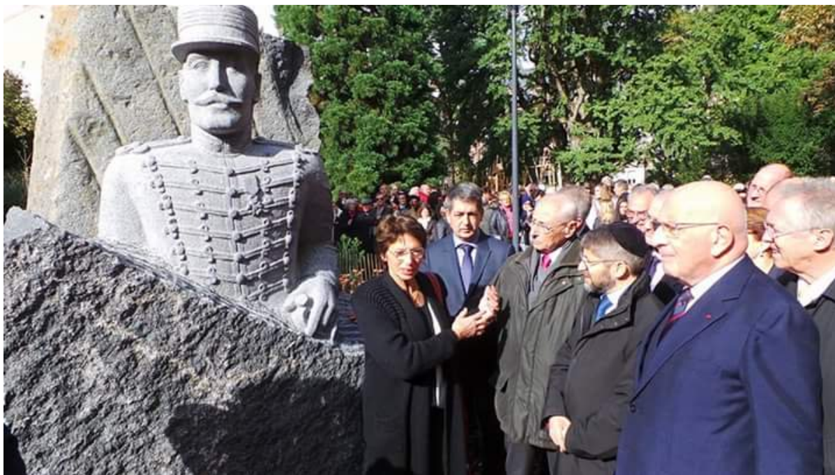
Открытие памятника в Мюлузе

Памятник знаменитому земляку был торжественно открыт в городе Мюлуз на северо-востоке Франции. Имя этого земляка знают далеко за пределами страны: капитан Альфред Дрейфус. Именно здесь на углу площади Победы и Rue de Sauvage в 1859 году родился человек, процесс над которым едва не расколол Третью республику.