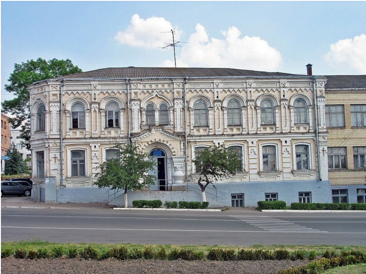
Школа №2, еще одна бывшая синагога

Есть и другие сложности. Например, у некоторых чиновников возник вопрос, мол, зачем указывать на плитах, что здесь покоятся именно евреи. Забывая, что их земляков расстреляли именно как евреев, исключительно в силу происхождения. В свое время у евреев, как общины, отобрали в Василькове все — синагоги, молитвенные дома, отдали под частную застройку участки, где шли расстрелы, и даже старое кладбище снесли, оставив, правда, «новое». Но уже в наше время кто-то хочет отобрать и национальность, чтобы вообще не звучало это «страшное» слово — евреи.