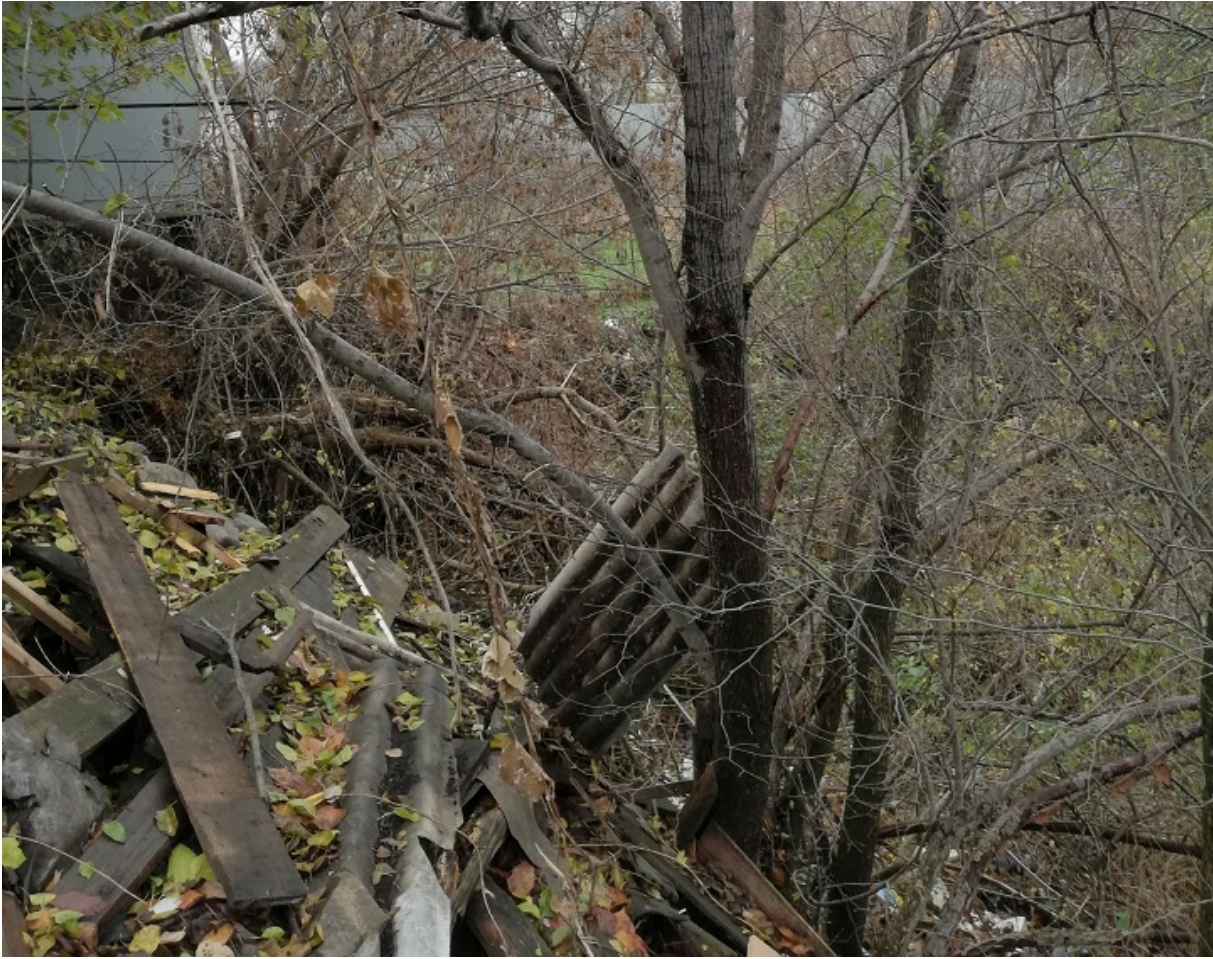
Так выглядит сегодня Покровский яр, где расстреливали евреев

«Все евреи г. Василькова обязаны явиться на сборный пункт для переезда в Палестину!», — такие объявления появились на улицах райцентра Киевской области в августе 1941 года.