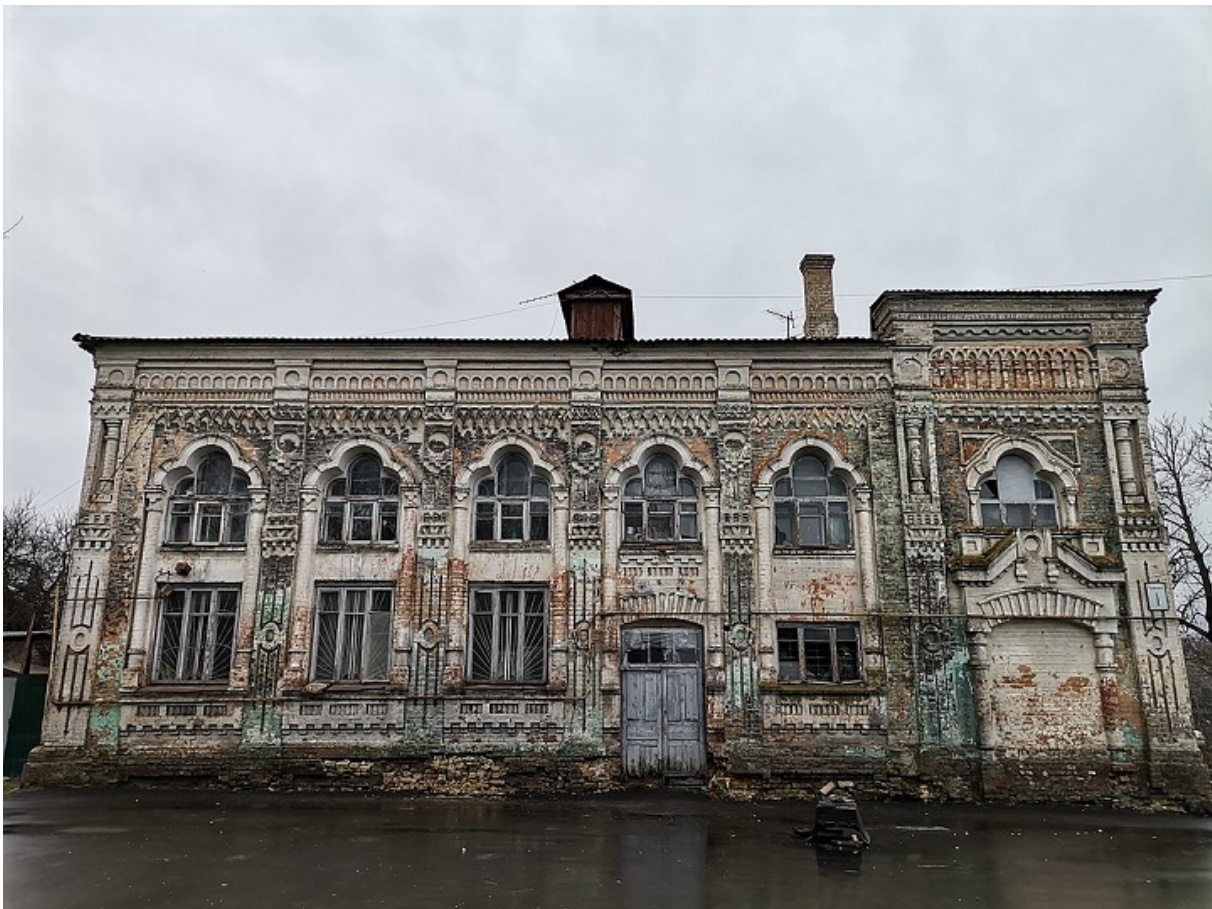
Заброшенное здание вокзала, бывшая синагога

Бомбить Васильков немцы начали едва ли не с первых дней войны, а 31 июля 1941-го в город вошли передовые части Вермахта. Эвакуироваться успели далеко не все, да и легко ли подняться старикам и женщинам с детьми, когда мужчины на фронте... Выживали, как могли, кто-то ходил по дворам в поисках пропитания, другие меняли вещи на продукты.