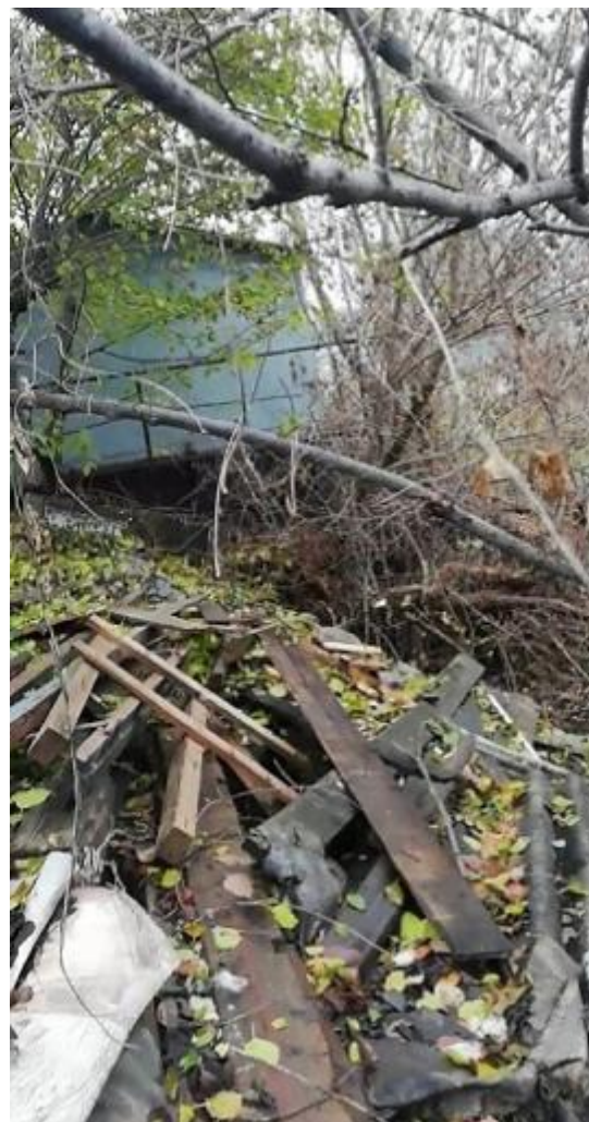
Покровский яр сегодня