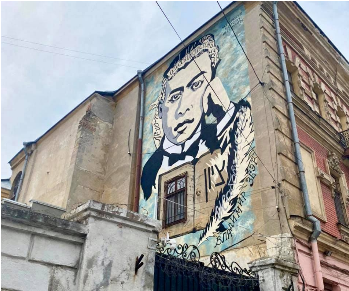
Мурал с портретом Владимира Жаботинского.

В 1880 году в доме на Базарной, 33, родился будущий писатель, публицист и переводчик, идеолог ревизионистского течения в сионизме, основатель Еврейского легиона, «Иргуна» и «Бейтара» Владимир Жаботинский.