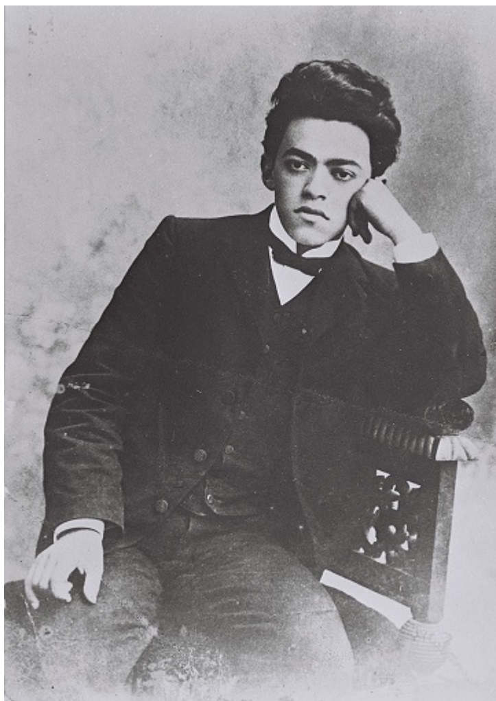
Юный Жаботинский, 1903