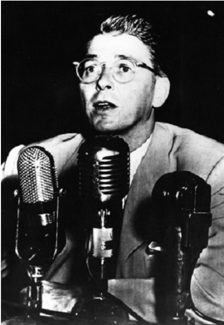
Рональд Рейган выступает на Комиссии по расследованию антиамериканской деятельности.