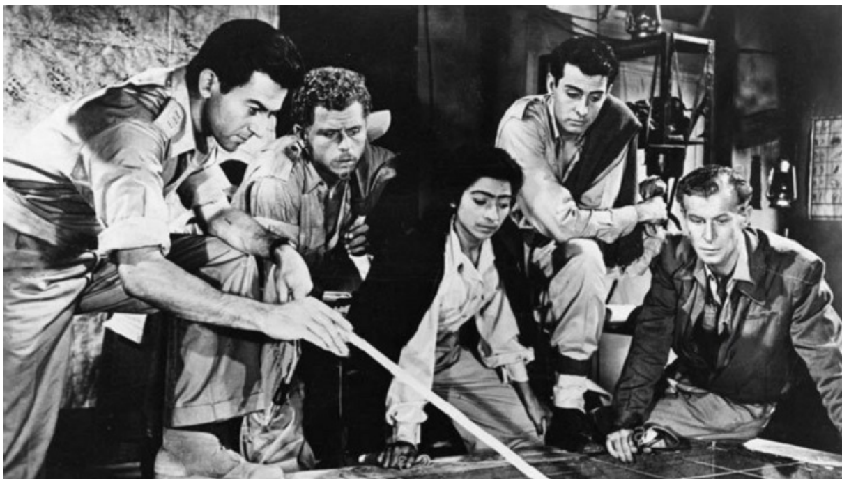
Кадр из фильма «Высота 24 не отвечает»