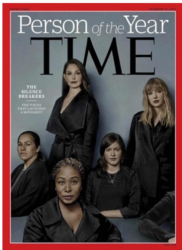
Героини движения me too на обложке TIME