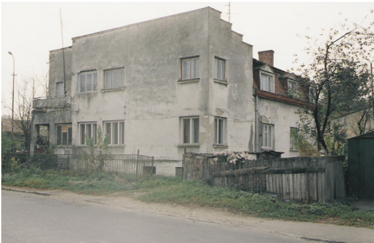
Дом, в котором жили супруги в Дрогобыче.

Большинство спасенных оказались в подвале в июне 1943 года, во время ликвидации гетто. Чаще всего их приводил сам Изидор, однажды жена даже сказала ему, не проще ли мол, вывесить объявление: «Прячем всех евреев, которым некуда идти, на Шашкевича, 9».