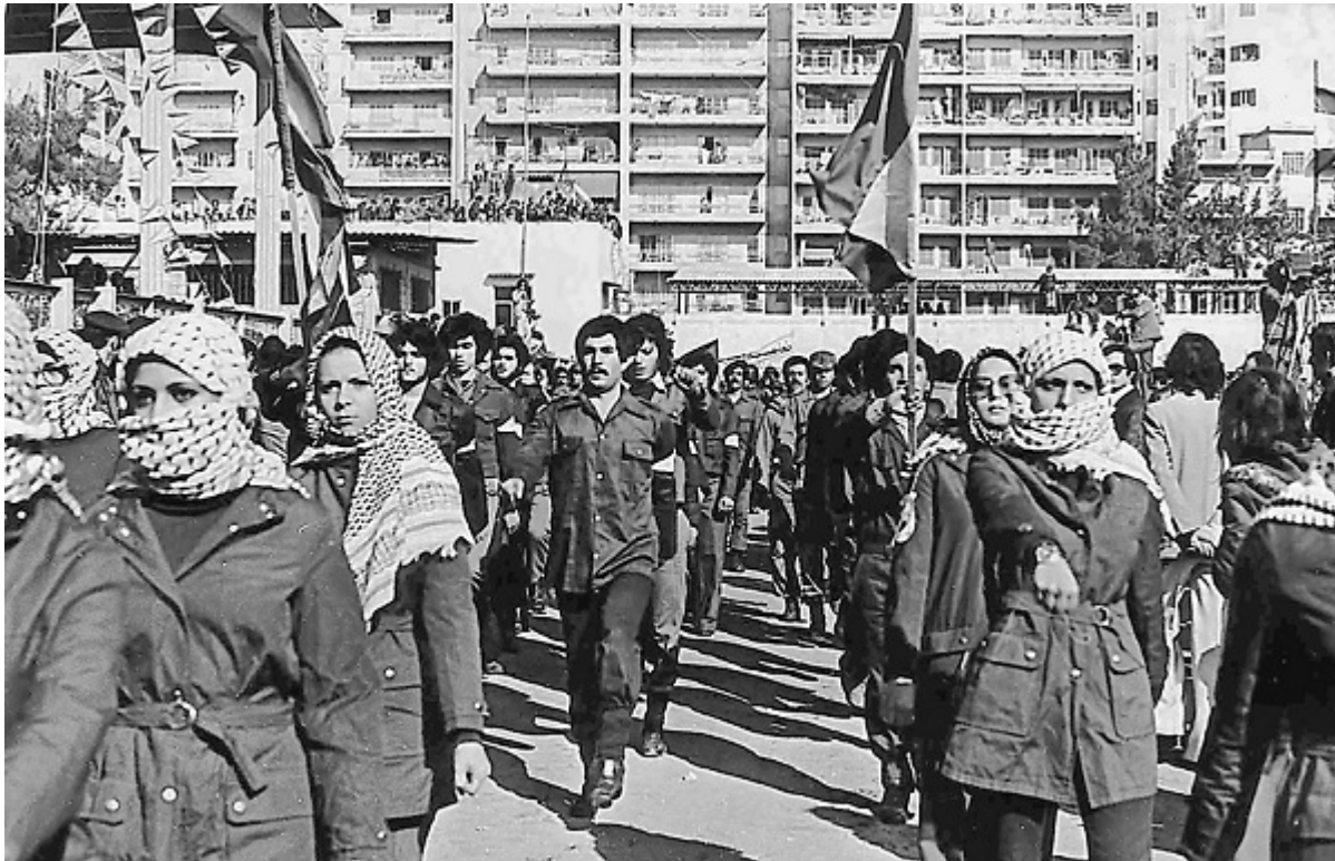
Молодые активисты ФАТХа на параде, Бейрут, 1979

Так и произошло. Только «Шабibu» сменили гораздо более агрессивные ХАМАС и Исламский джихад. При этом все попытки договориться с палестинскими лидерами обречены на провал, поскольку система власти на Ближнем Востоке построена на влиянии отдельных хамул — кланы могут веками враждовать между собой, вы не можете уладить дело с законно избранным главой государства, рассчитывая на лояльность ему всех остальных кланов. Процесс формирования наций, занявший в Европе столетия, на Востоке еще не завершен.