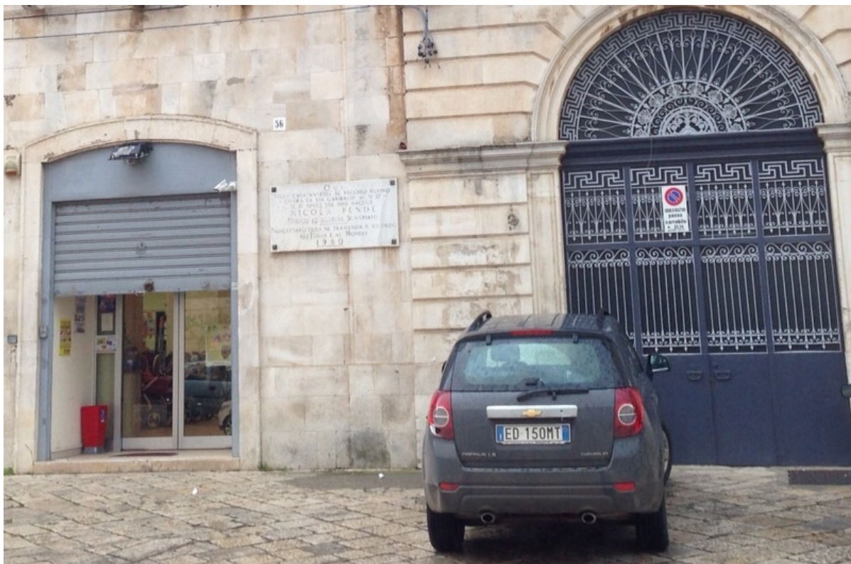
Памятная доска на доме, где родился сенатор Никола Пенде

Волна переименований, захлестнувшая в последние пару лет украинские города, докатилась до... Рима. Это, разумеется, шутка. Хотя мэр Вечного города Вирджиния Раджи действительно планирует переименовать улицы, названные в честь персон, подписавших летом 1938-го так называемый «Расовый манифест», дискриминировавший сограждан-евреев. Документ завизировали тогда не последние в стране люди — представители интеллектуальной элиты, ученые, преподаватели ведущих университетов. На его основании осенью того же 1938-го года был принят «Закон о защите расы», запрещающий евреям посещать учебные заведения, включая общеобразовательные школы, занимать должности в государственных и научных учреждениях, преподавать, служить в армии, участвовать в конференциях, печататься в газетах и журналах даже под псевдонимом и т.д.