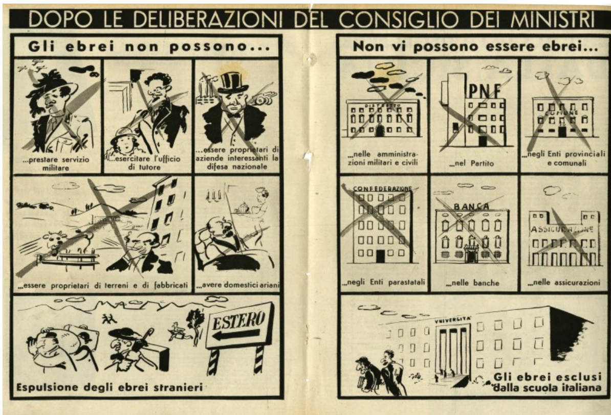
Комикс, иллюстрирующий расовые законы, 1938

Это было тем более удивительно, что поначалу Муссолини отвергал идею высшей расы как «глупую и идиотскую», подчеркивал, что своими действиями антиеврейские организации порочат саму фашистскую идею и клеймил антисемитизм как «германское зло». Множество евреев были активными членами фашистской партии Италии, пост министра финансов и секретаря Казначейства занимал в 1932 — 35 гг. еврей Гвидо Юнг , а в Лиге Наций страну представлял еврей Фульвио Сувич , по сути руководивший внешней политикой Италии.