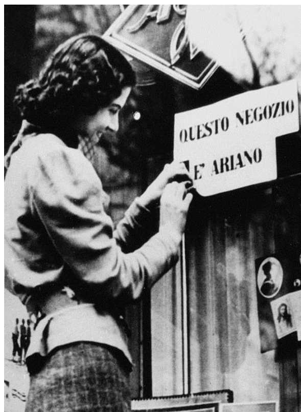
Расклейка объявлений об аризации имущества, Рим, 1938