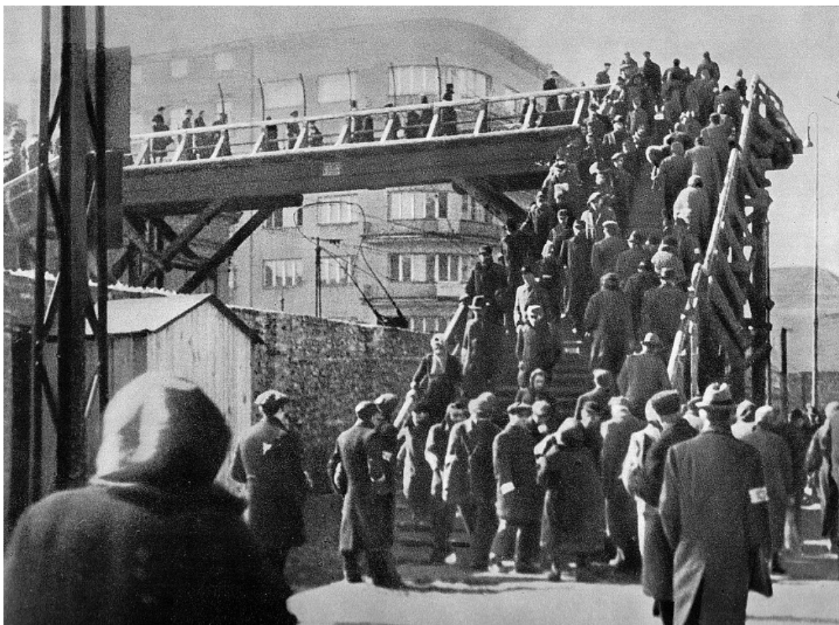
Пішохідний міст, який веде у Варшавське гетто, 1942

Після хвилі депортацій, юнак вступив у Єврейську бойову організацію (Żydowska Organizacja Bojowa, або ŻOB) — найбільшу з осередків єврейського Опору. «У 1942-му, коли мені було 18 років, а мамі 40, її відвезли в Треблінку. Одного разу я повернувся з примусових робіт, і її вже не застав», — згадував чоловік в інтерв'ю Ynet у 2018 році. Тоді за два місяці до таборів смерті депортували з Варшави понад 250 000 євреїв.