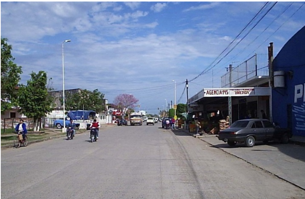
В центрі містечка Клоринда