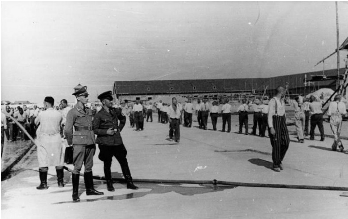
Концтабір Заксенхаузен, 1938

Незважаючи на це 1 липня 1937 року Німеллера знову заарештували — до того моменту на нього завели вже приблизно 40 справ. Його арешт викликав хвилю солідарності всередині країни і за межами Німеччини. 7 лютого 1938 року пастора засудили до семи місяців тюремного ув'язнення, які він уже відбув до суду. Але вийти на свободу Мартіну не дали — засуджений був тут же знову заарештований гестапо і відправлений до концтабору Заксенхаузен як «особистий полонений» Адольфа Гітлера.