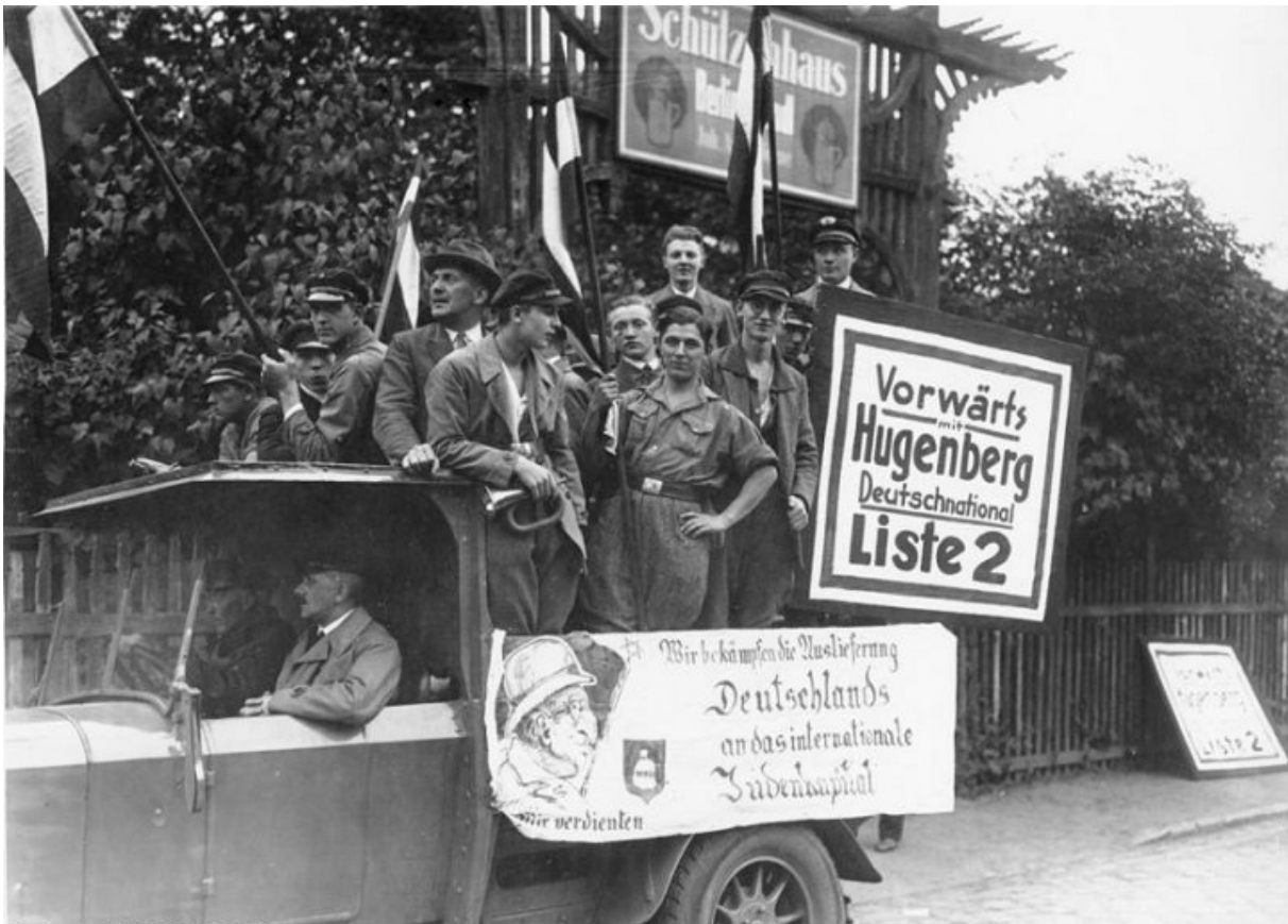
Передвиборна кампанія Німецької національної народної партії під антисемітськими гаслами

На початку 1920-х Німеллер планував стати фермером, але оскільки грошей на придбання садиби не вистачало, вирішив вивчати протестантське богослов'я. Це не завадило йому вступити в 1924-му в НСДАП. У 1931 році священника призначили пастором євангельської громади престижного берлінського району Далем. Він як і раніше підтримував нацистів, вважаючи, що Німеччині потрібна сильна рука. У той час приблизно половина німців сповідували католицизм, і стільки ж було протестантів-лютеран. Протестантська церква явно грала на боці НСДАП, у той час як серед католиків було більше опозиціонерів. Пастора навіть хвалять у партійній пресі за військове минуле й нацистське сьогодні.