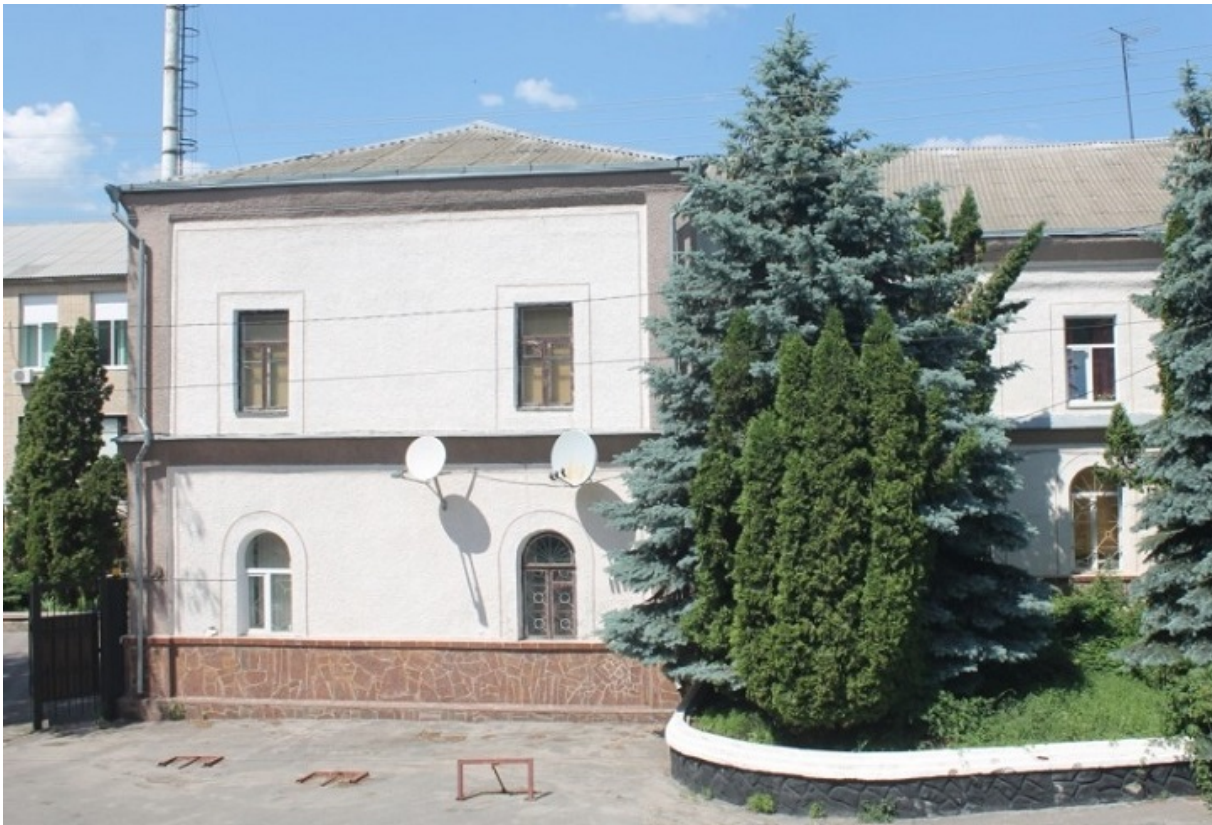
Будівля хоральної синагоги, нині РВВС