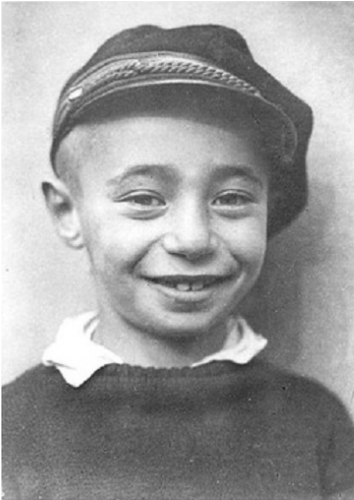
Іцхак у дитинстві