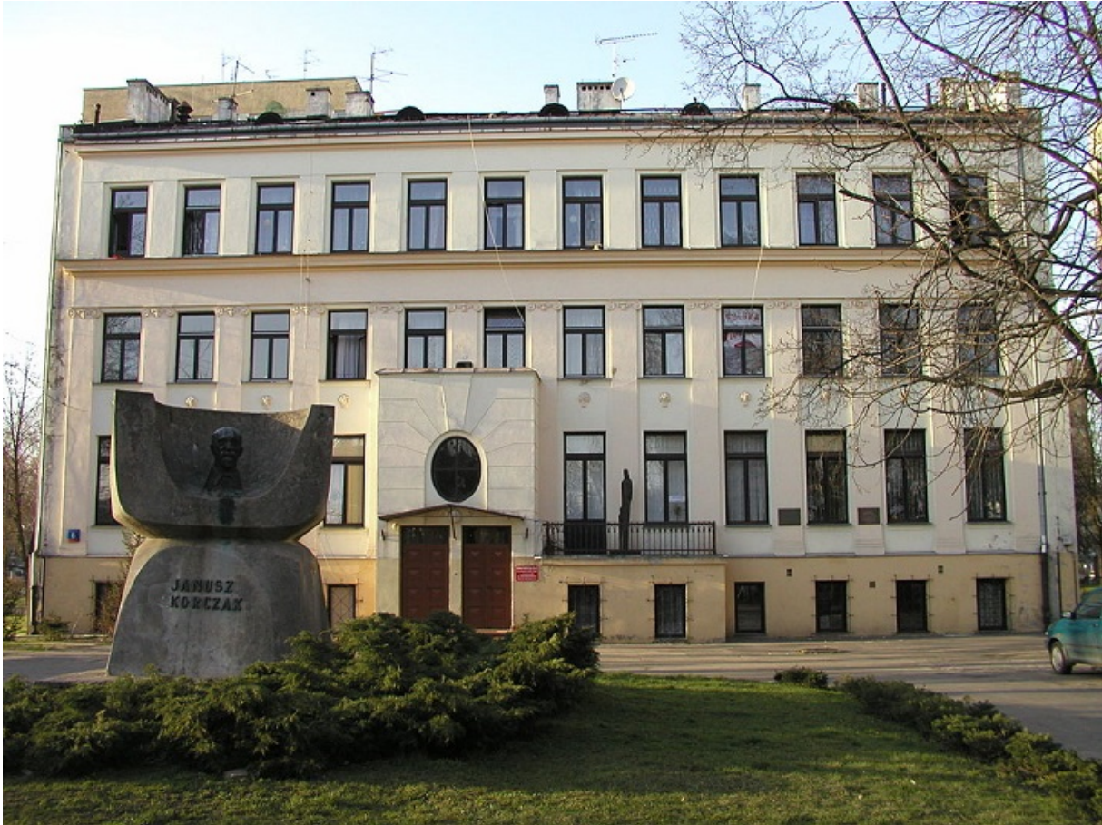
Так виглядає Дитячий будинок Корчака сьогодні. Перед ним - пам'ятник великому педагогу

Після початку Другої світової й окупації Польщі, хлопець із другом вирішили бігти в Радянський Союз, і прийшли до Корчака за благословенням. «Ця остання наша розмова була дуже сумною, — згадував Іцхак. — Діти й пані Стефа стояли осторонь. Корчак вигріб із кишені все, що в нього було, і дав нам грошей на дорогу. Ми отримали його благословення і ...бачили його востаннє».