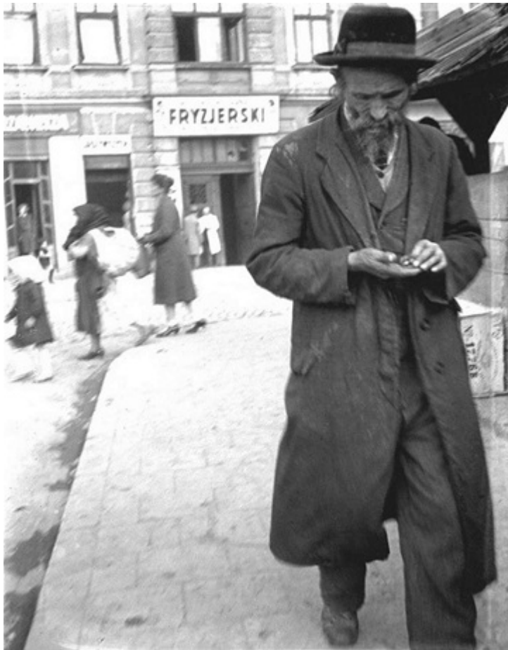
У Краківському передмісті, 1930-і