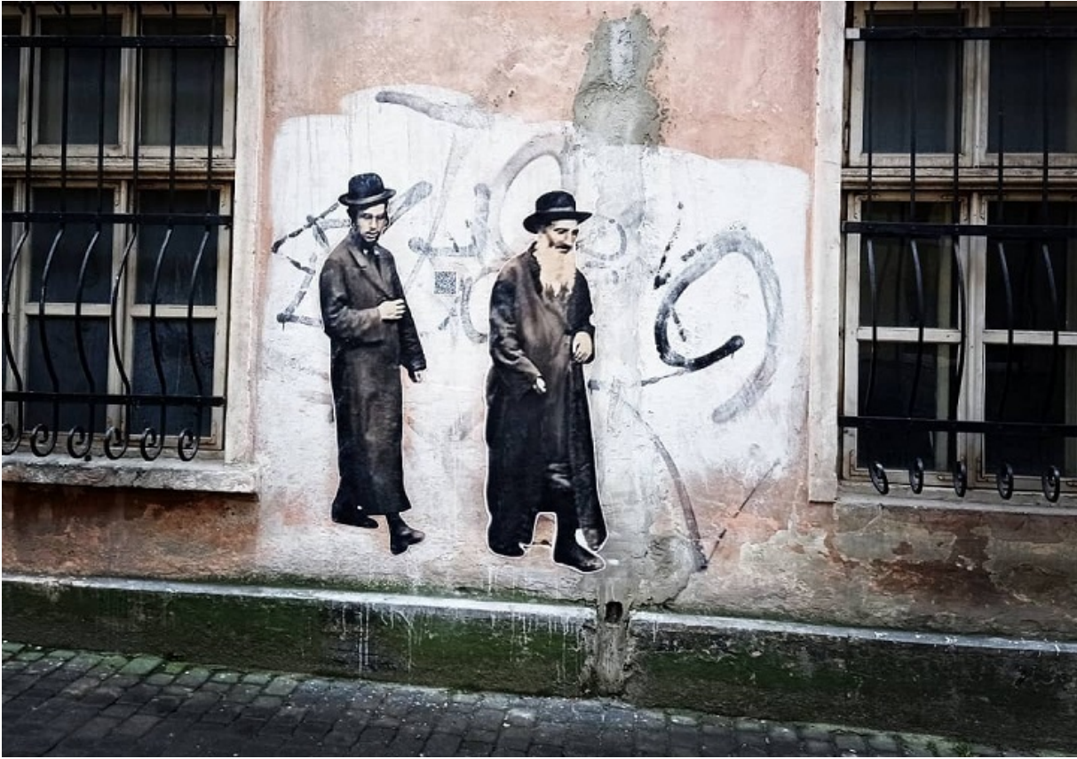
Графіті на вулиці Вугільна