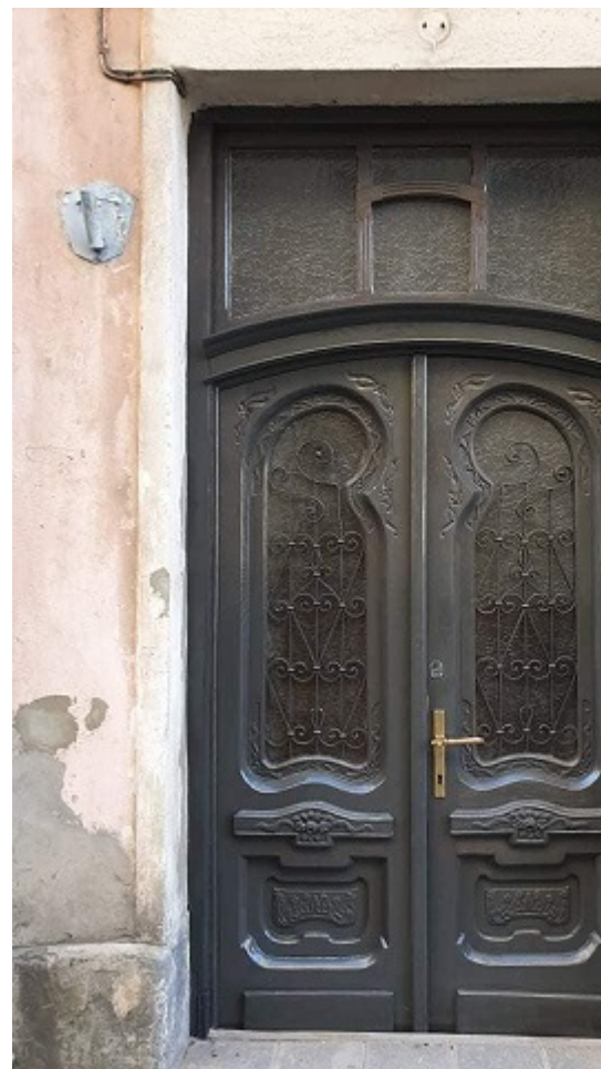
Відновлені двері синагоги

На жаль, на початку нового століття фінансування Товариства майже припинилося, і на утримання будівлі та оплату комунальних послуг катастрофічно не вистачало коштів. До всього іншого, у 2009 році ураган зірвав дах синагоги, перетворивши будинок в аварійний об'єкт.