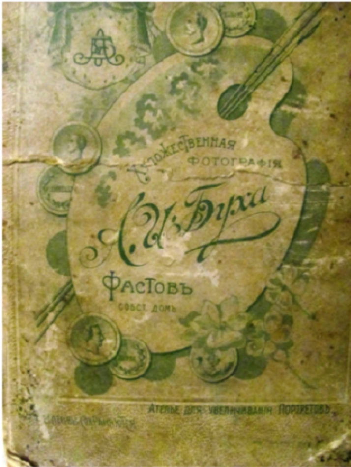
Реверс однієї із фотографій Арона Буха