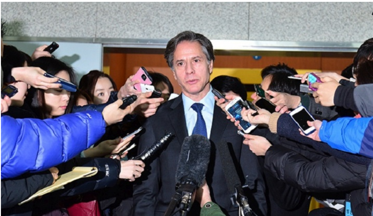
Ентоні Блінкен.