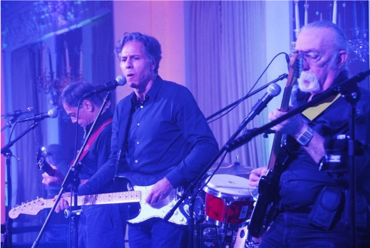
Блінкен зі своїм рок-гуртом виступає в посольстві Великої Британії.

Що стосується Ентоні, то він закінчив Гарвард і Колумбійський університет, займався приватною адвокатською практикою, працював в апараті Ради національної безпеки США в Білому домі, в 1994 — 1998 рр. був спеціальним помічником президента, у 2002-му став директором сенатського Комітету з міжнародних відносин.