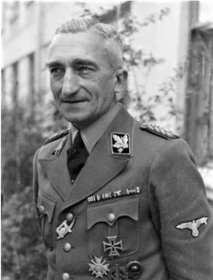
Группенфюрер СС Артур Небе.