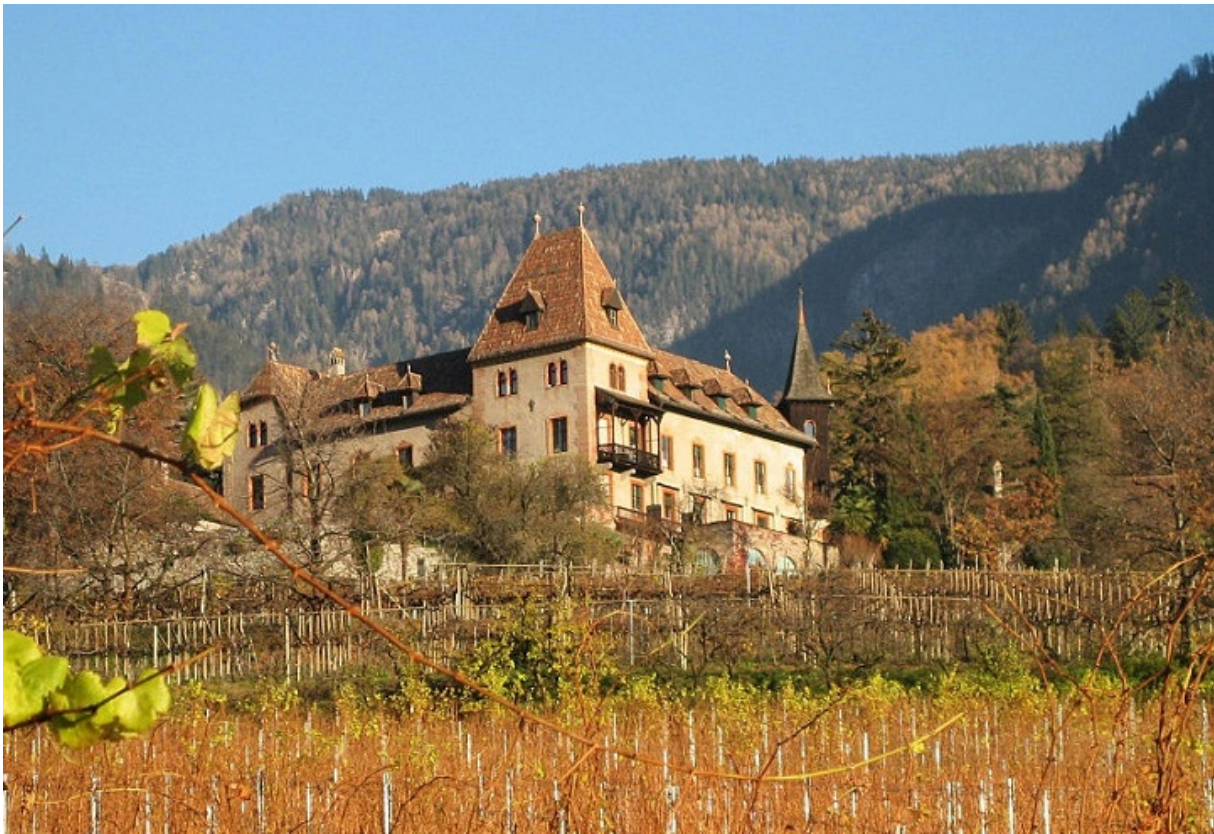
Замок Лаберс в Южном Тироле — перевалочный пункт фальшивых фунтов

Полученные средства гитлеровцы тратили на покупку оружия на черном рынке и его переправку пронацистским формированиям в юго-восточной Европе. Фальшивыми деньгами снабжали агентов немецкой разведки. С одним из них, Эльясом Базной, под кодовым именем Цицерон, продукция операции «Бернхард» сыграла злую шутку. Базна был камердинером английского посла в Турции. Он смог получить доступ к служебным документам посольства, которые копировал и передавал немцам. За свои труды он скопил 300 тысяч фальшивых фунтов.