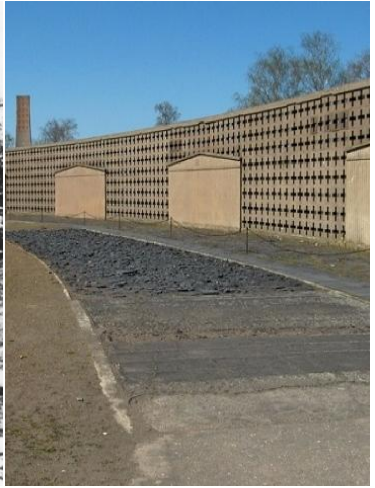
Трек для испытания обуви