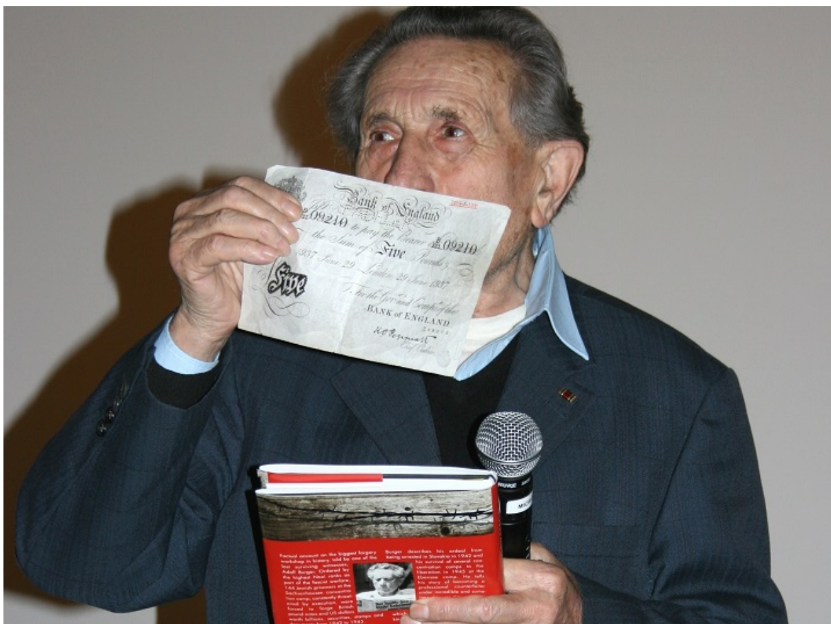
Адольф Бургер с поддельной британской банкнотой, Париж, 2008.

Одной из малоизученных страниц истории Второй мировой является «финансовая война» — дестабилизация и подрыв экономики противника. Оружие в этой войне — фальшивые деньги, — подчеркивает д-р Борис Хавкин в издании НВО.