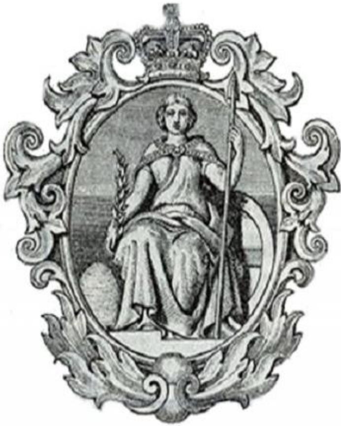
Аллегорическое изображение Британии на английской купюре