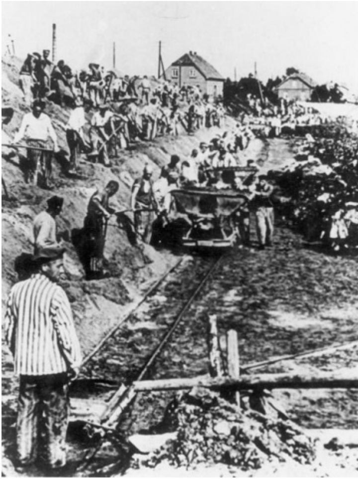
Узники Заксенхаузена.