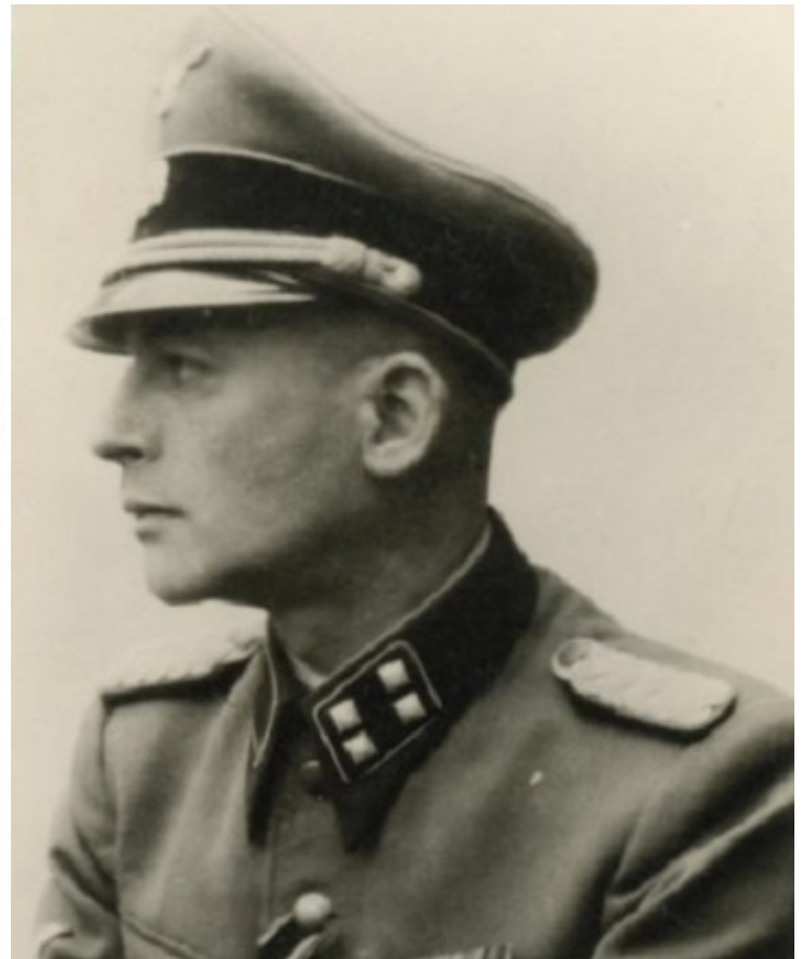
Штурмбаннführер СС Бернхард Крюгер