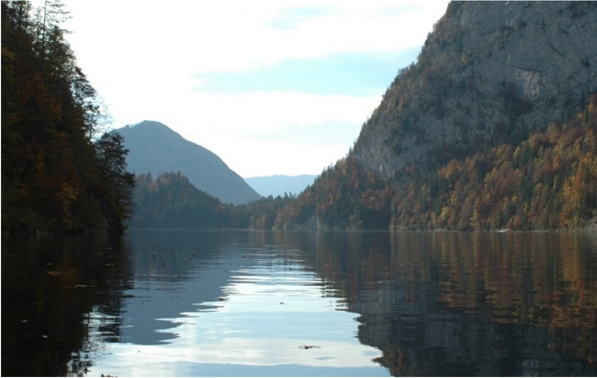
Озеро Топлиц, где затопили остатки фальшивых банкнот