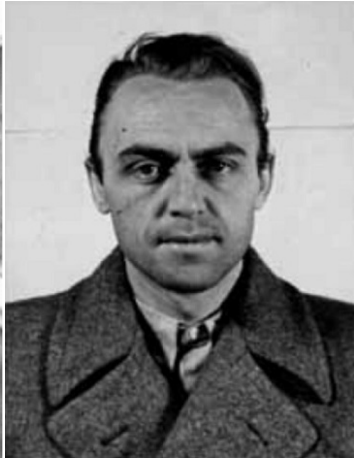
Начальник группы «VI Ф» Альфред Науйокс

Через семь месяцев фальшивомонетчики изготовили копию, похожую на оригинал. Однако отличия остались: «тусклый» взгляд Британии на немецкой фальшивке и не проработанный на короне крест. Так что большинство полученных в ходе операции «Андреас» банкнот остались неиспользованными.