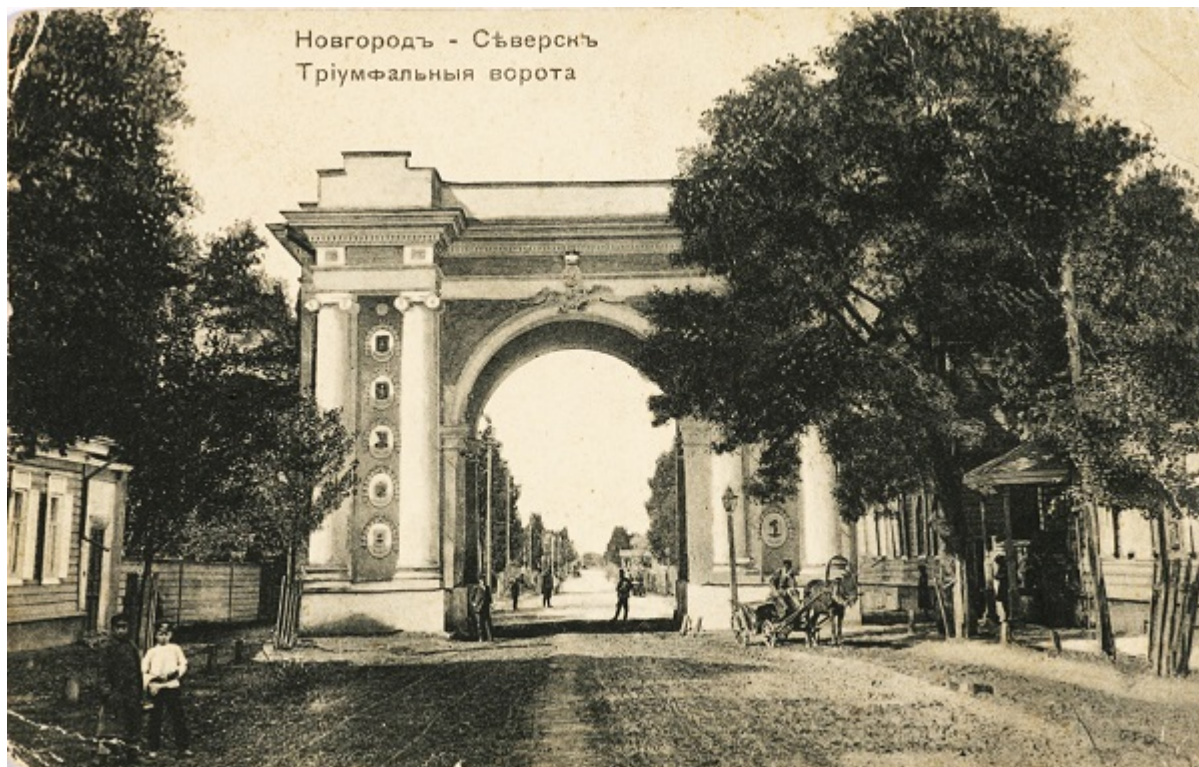
Новгород-Северский, старая открытка

Сегодня Новгород-Северский — небольшой райцентр Черниговской области, но примерно тысячу лет назад город был столицей удельного княжества, защищавшего Киев от половцев. Здесь правил внук Ярослава Мудрого, а в конце XII века княжеский престол занял князь Игорь Святославович — главный герой «Слова о полку Игореве».