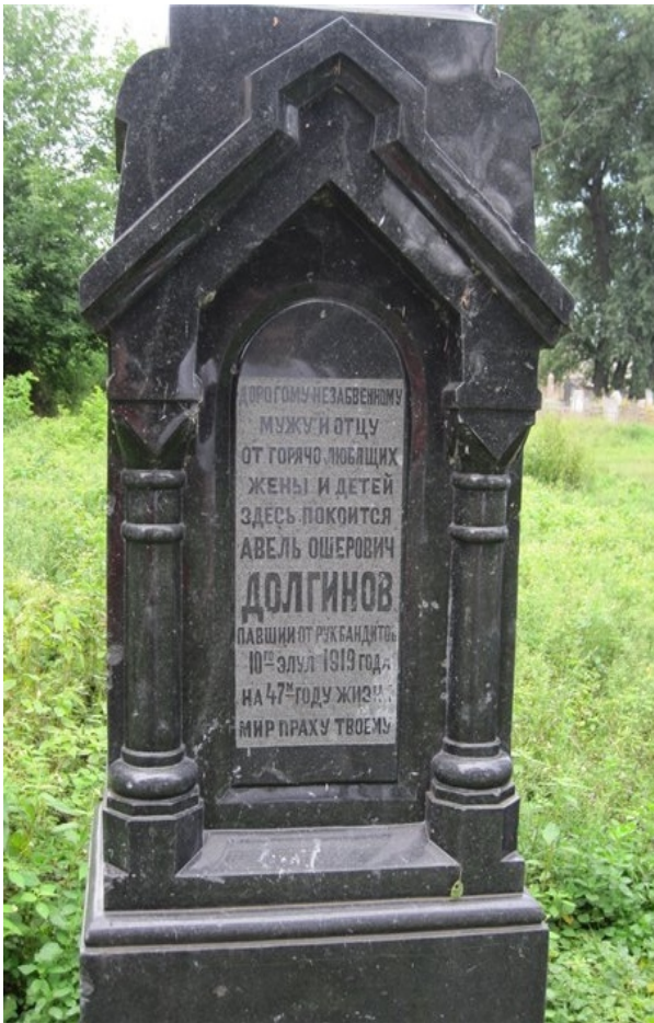
Одна из могил на еврейском кладбище.