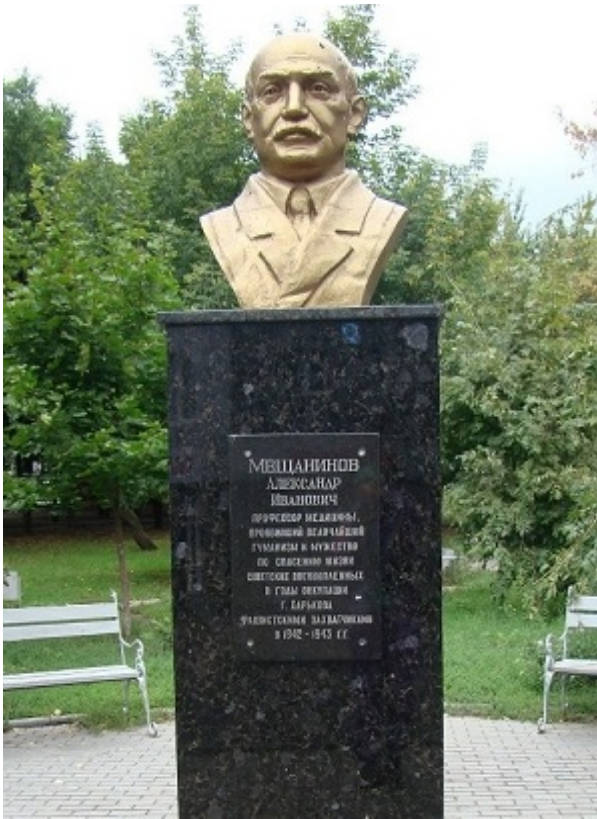
Памятник Мещанинову.