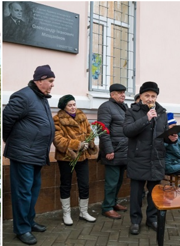
На открытии памятной доски.